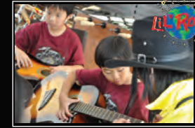
منتدى الاطفال (ليل)