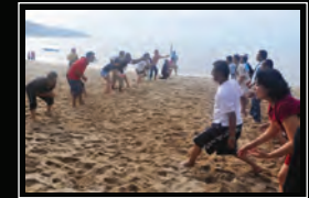
فريق البناء الرملي روكن