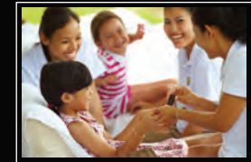
المنتجع المعدني لروك